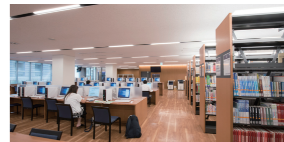
臨床教育研究棟 図書館(相模原キャンパス)