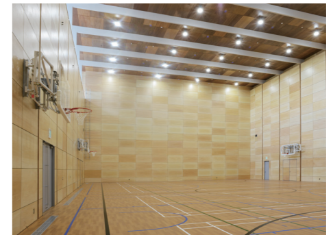
2019年度完成(白金キャンパス) プラチナアリーナ(内観)

遺言書を作り、ご自身が築き上げられた財産の全部または一部を寄付することを遺贈といいます。