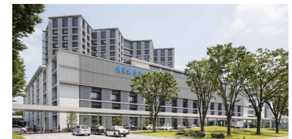
北里大学病院 本館(相模原キャンパス)