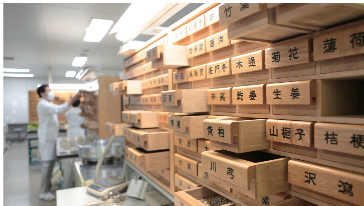
東洋医学総合研究所 調剤室 百味単筒(白金キャンパス)