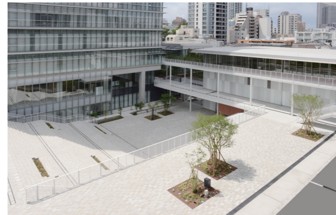
2019年度完成(白金キャンパス) ソフィアプラザ(広場)とプラチナアリーナ(右)