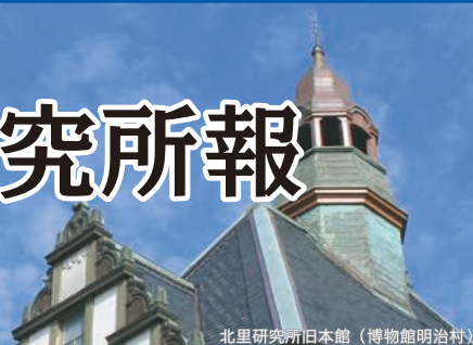
北里研究所旧本館（博物館明治村）